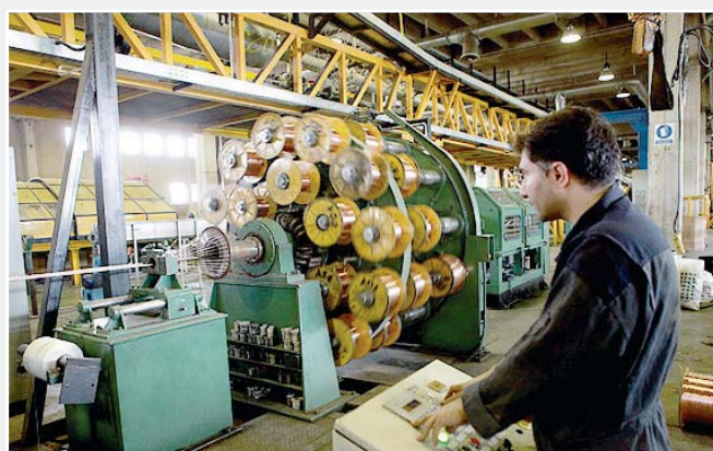
معتلات بزرگ ساختار بازار سرمایه برای بنگاه‌های اقتصادی بررسی شد