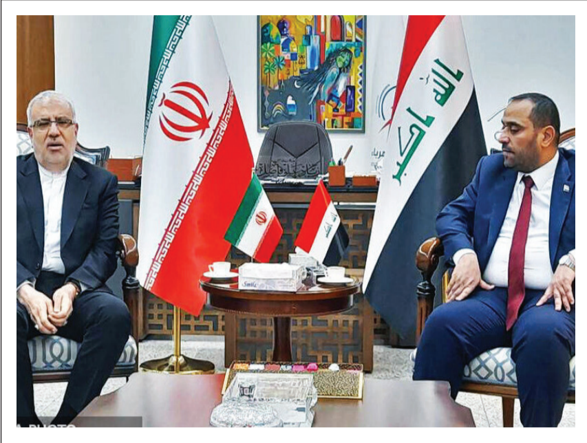
اساس توافق دو طرف این دو قرارداد طی ۵ سال آینده بر اساس این گزارش، طی دیدار وزیر نفت با مقام‌های عراقی زمینه‌های همکاری ایران و عراق در تمدید خواهد شد.

وزیر نفت با یادآوری اینکه ایران هم‌اکنون دو قرارداد انتقال گاز با نیروگاه‌های بغداد و بصره عراق دارد، گفت: بر اساس توافق دو طرف این دو قرارداد طی پنج سال آینده تمدید خواهد شد.