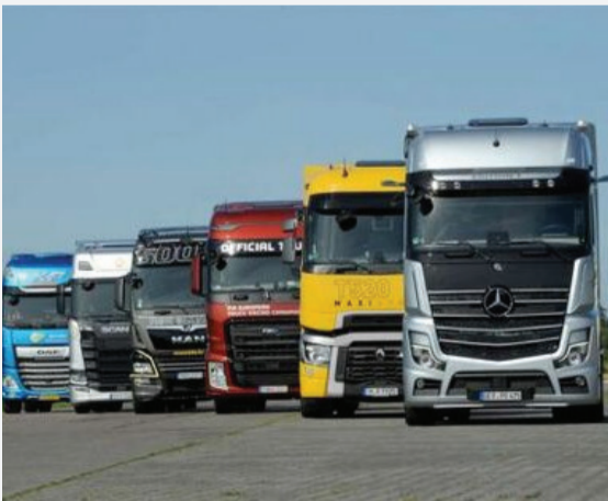
این تجاری سازی بزرگ با ۳۶ درصد افزایش به ۲۲ هزار و ۶۲۶ دستگاه رسید.

شرکت دیگری که به‌عنوان یکی از برترین تولیدکنندگان خودروهای سنگین تجاری در جهان شناخته می‌شود، «مان» آلمان است. این شرکت تاکنون موفق به تولید ۸۳۲۰ دستگاه از انواع کامیون‌های سنگین و نیمه‌سنگین شده است. شرکت مان یکی از شرکت‌های تابعه شرکت MANSE است که به‌عنوان بزرگ‌ترین ارائه‌دهنده وسایل نقلیه تجاری بین‌المللی شناخته می‌شود. به‌رغم توقف شش‌هفته‌ای تولید در نیمه اول سال در نتیجه جنگ اوکراین و بسته شدن گلوگاه‌های عرضه در پی آن، این سازنده خودروهای تجاری توانست به درآمد فروش ۱۱.۳ میلیارد یوروی دست پیدا کند که در مقایسه با سال پیش از آن رشد اندکی را شاهد بوده است. ایوکو یک شرکت تولیدکننده خودروهای صنعتی مستقر در ایتالیا است که به‌طور کامل توسط گروه صنعتی CNH کنترل می‌شود. این شرکت بزرگ خودروسازی با موفقیت ۱۳۴۳۰۰ کامیون سنگین را در سراسر جهان فروخته