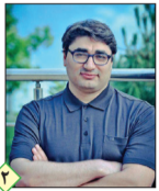
حامد قدوسی اقتصاددان و استاد دانشگاه