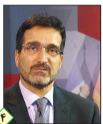
مهرداد عمادی اقتصاددان