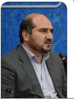
مهدی یوسفی، معاون اجرایی رئیس‌جمهور

است. وی افزود: دولت سیزدهم با تلاش شبانه روزی خود سعی دارد که این مهم را محقق کند. وی افزود: امروز دشمنان قسم خورده نظام با استفاده از تمامی امکانات خود در حال ایجاد دست انداز و سنگ اندازی در مسیر پیشرفت ایران اسلامی هستند تا کشور را از مسیر پیشرفت و توسعه دور کنند. مسئولان باید با تلاش شبانه روزی، دشمنان را در دستیابی به اهداف شوم خود ناامید کنند چرا که نزدیک شدن به قله‌های پیشرفت و توسعه، دشمن رایش از پیش مایوس و البته خشمگین می‌کند.