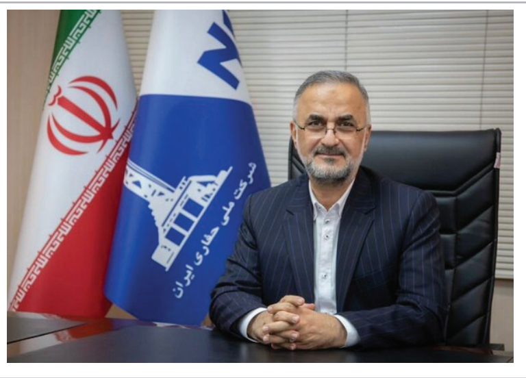
توجه ویژه دولت به ناوگان عملیاتی این شرکت است. گلپایگانی ساخت ۷۰ درصد از قطعات مورد نیاز دستگاه‌های حفاری توسط سازندگان داخلی و شرکت‌های دانش بنیان را از دیگر دستاوردهای