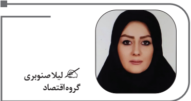
کجه لیبلاصنوبری گروه اقتصاد

کاهش ۵.۴ درصد قیمت‌های قطعی پس از آن ایجاد شد که نرخ‌های پیش‌فروش ۲۰ تا ۳۰ درصد کاهش یافت و این امیدواری را ایجاد کرد که به تدریج حباب قیمت مسکن تخلیه شود. در حال حاضر قیمت دلاری مسکن به حدود ۱۵۰۰ دلار رسیده که فقط در اواخر دهه ۸۰ نرخ بالاتر از این رقم را به ثبت رسانده و هم‌اکنون در مقایسه با میانگین بلندمدت که در سطح ۱۰۰۰ تا ۱۲۰۰ دلار قرار داشته حدود ۵۰ درصد حباب دارد. از طرف دیگر قیمت مسکن طی شش سال اخیر ۱۳۸۰ درصد رشد داشته که ۳۰۰ درصد بیش از رشد قیمت دلار بوده و این آمار نیز قرصه ثبات قیمت مسکن در میان مدت را تقویت می‌کند. در حال حاضر حجم قابل توجهی فایل فروش در بازار مسکن به شهر تهران وجود دارد که عمدتاً با نرخ‌هایی به مراتب کمتر از اوایل سال جاری عرضه شده است، به طوری که در برخی مناطق جنوبی تهران می‌توان مالیاتی کمتر از ۲ میلیارد تومان صاحب خانه شد.