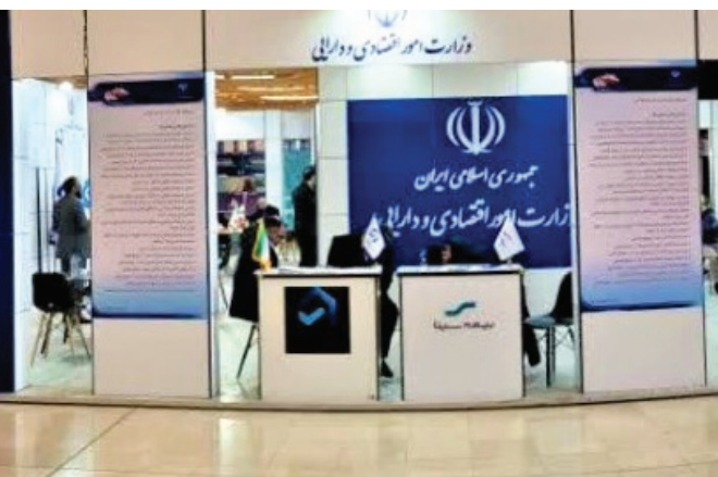
دومین نمایشگاه مدیریت بحران ایران قوی ۱۴۰۲

و دارای در این نمایشگاه حضور فعال دارد. سیاح با اشاره به نقش جایگاه صنعت بیمه در حوادث وبلائیایی طبیعی افزود: صاحبان کسب و کار و منازل مسکونی که داری بیمه با پوشش‌های تکمیلی می‌باشند در مواقع بروز حوادثی مانند سیل و زلزله خیلی زودتر از دیگران موفق به بازسازی و برگشت به وضعیت قبل از حادثه می‌گردند. بیمه ایران همراه سایر شرکت‌ها و سازمان‌های زیر مجموعه وزارت امور اقتصادی