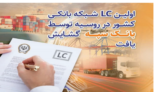
اولین LC شبکه بانکی کشور در روسیه توسط بانک سپه گشایش یافت

حداکثری» بی‌سابقه است. ارزش این LC که از امروز مورد استفاده قرار گرفته، برای شروع مبلغ ۱۷ میلیون پورو است و با شرط پرداخت مدت‌دار جهت واردات استفاده می‌شود.