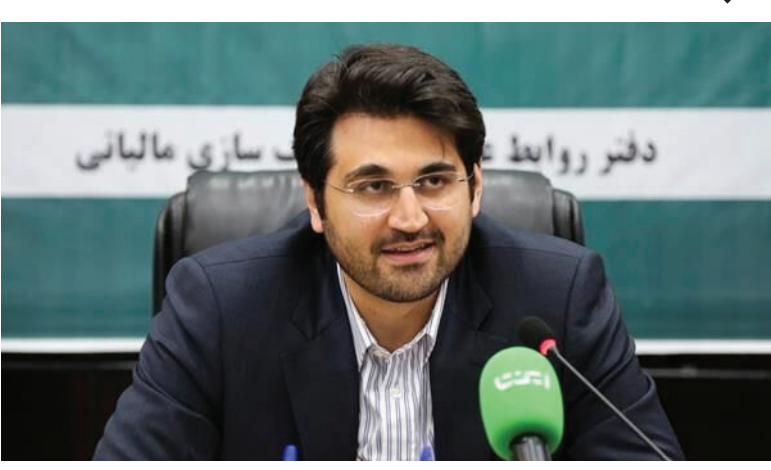
فرزین با اشاره به سفر اخیر خود به روسیه خاطرنشان کرد: صادرات ما به روسیه نسبت به واردات کمتر بوده و ناترازی داریم. یک اقدام خوب ما این بوده که در فصل اول سال آینده میلادی پیمان پولی ایران و روسیه امضا خواهد شد، یعنی می‌توان با روبل و ریال تجارت کرد. همچنین کارتابل دو کشور به یکدیگر وصل شده و افرادی که کارت دارند می‌توانند بین دو کشور با یکدیگر تجارت کنند. دو ماهه داد: رشد صادرات ما به روسیه بیشتر از رشد واردات از این کشور بوده است یعنی از تجارت با روسیه سود می‌بریم. همچنین با عضویت ایران در اتحادیه اوراسیا، تعرفه ۸۷ درصد کالاهای ایران، روسیه، قزاقستان و قرقیزستان صفر شده و به راحتی می‌توان تجارت داشت

ما مجبوریم از منابع استان‌های توسعه یافته، بخشی از منابع استان‌های کمتر توسعه یافته را تأمین کنیم. رئیس کل بانک مرکزی در خصوص بازگشت منابع شرکت‌هایی که در استان فعالیت داشته، اما حساب‌های بانکی آن‌ها در تهران است، تصریح کرد: به عنوان مسئولین استانی می‌توانید ورود پیدا کرده