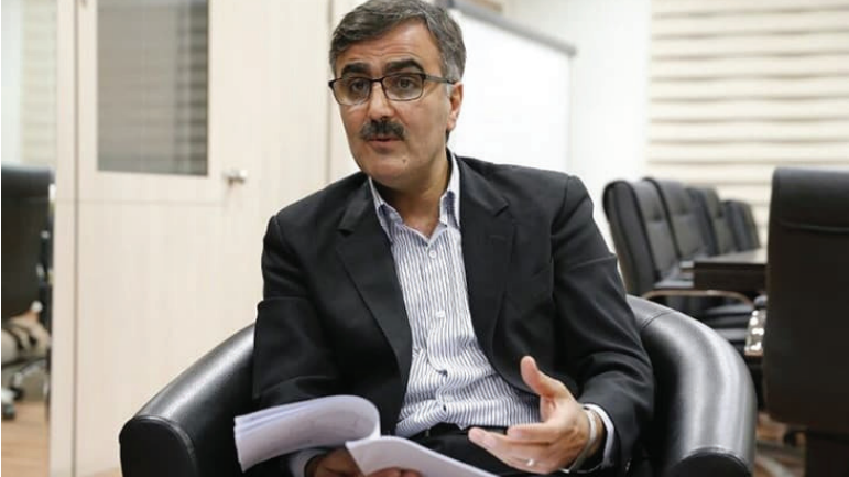
فرزین با اشاره به سفر اخیر خود به روسیه خاطرنشان کرد: صادرات ما به روسیه نسبت به واردات کمتر بوده و ناترازی داریم. یک اقدام خوب ما این بوده که در فصل اول سال آینده میلادی پیمان پولی ایران و روسیه امضا خواهد شد، یعنی می‌توان با روبل و ریال تجارت کرد. همچنین کارتابل دو کشور به یکدیگر وصل شده و افرادی که کارت دارند می‌توانند بین دو کشور با یکدیگر تجارت کنند. دو ماهه داد: رشد صادرات ما به روسیه بیشتر از رشد واردات از این کشور بوده است یعنی از تجارت با روسیه سود می‌بریم. همچنین با عضویت ایران در اتحادیه اوراسیا، تعرفه ۸۷ درصد کالاهای ایران، روسیه، قزاقستان و قرقیزستان صفر شده و به راحتی می‌توان تجارت داشت

بر اساس گزارش مرکز آمار ایران، منظور از تورم نقطه به نقطه، درصد تغییر عدد شاخص قیمت نسبت به ماه مشابه سال قبل می‌باشد. در آذر ماه ۱۴۰۲ تورم نقطه به نقطه خانوارهای کشور، ۴۰.۲ درصد بوده است؛ یعنی خانوارهای کشور به طور میانگین، ۴۰.۲ درصد بیشتر از آذر ماه ۱۴۰۱، برای خرید یک «مجموعه کالاها و خدمات یکسان» هزینه کرده‌اند. تورم نقطه به نقطه آذر ماه ۱۴۰۲ در مقایسه با ماه قبل، ۱.۰ واحد درصد افزایش داشته است.