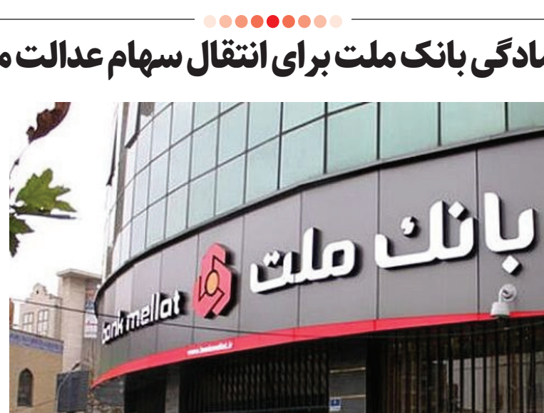
ترتیب در مسیر تحقق سیاست‌های دولت گام بر دارد.

بر اساس این گزارش، طرح سهام عدالت یکی از برنامه‌های اجرا شده از سوی دولت نهم بود