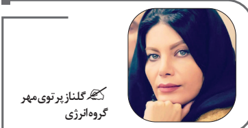
گروه انرژی گلزار پتروپهر

پس از تحریم های نفتی آمریکا علیه ایران، مشتری های نفتی واردات نفت از ایران را کاهش دادند و برخی از آنان حتی آمار واردات نفت از ایران را به صفر رساندند. اما در میان این خبرها ۴۰ پالایشگاه چینی در ماه اکتبر حدود ۱.۴۵ میلیون بشکه نفت از ایران خریداری کرده‌اند که بیشترین رقم واردات ماهانه تاکنون بوده است. به گزارش رویترز، میزان واردات نفت خام چین به دلیل افزایش تولید نفت ایران به رغم تحریم‌ها و تهدیدهای آمریکا، رکورد جدیدی را ثبت کرد. بر اساس آمارهای ردیابی کشتی‌ها از ورتکس، چین به عنوان بزرگ‌ترین واردکننده نفت خام و همچنین مشتری بزرگ نفت ایران در ۱۰ ماهه نخست سال ۲۰۲۲ به‌طور میانگین ۱۰۵ میلیون بشکه در روز از ایران نفت وارد کرده است. این میزان ۶۰ درصد بالاتر از اوج واردات چین در قبل از تحریم‌ها در سال ۲۰۱۷ است. میزان تولید نفت ایران به ۳.۱۷ میلیون بشکه در روز رسیده است که بیشترین میزان از سال ۲۰۱۸ تاکنون است. آمارهای ورتکس نشان می‌دهد؛ میزان واردات نفت چین در ماه اکتبر از