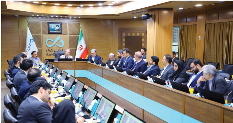
عملیاتی بانک بهبود یابد.

مدیرعامل بانک دی با توصیه به کارکنان به التزام به اخلاق حرفه‌ای در رفتار با مشتری و همکار گفت: اگر مسئولیت‌پذیری ما ریشه در اخلاق حرفه‌ای داشته باشد، اعتماد، که گرانبهاترین دارایی مشتریان نزد ماست، در ذهن مشتری و در روابط میان همکاران ایجاد می‌شود. اسکندری در پایان با اشاره به افزایش سرمایه بانک، یکپسیری خروج نماد دی از تعلق، تحول در امور ارزی و بین‌الملل، بهبود