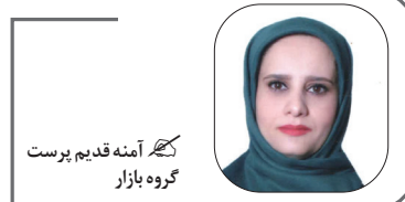
گروه بازاری کهنه آینه قدیم پرست

بر اساس آمار ارائه شده در حالی نرخ بهره بین بانکی در پایان هفته گذشته روند کاهش خود را حفظ کرد و به ۲۳٫۵۶ درصد رسیده است. در از اواسط مرداد روند رو به رشد داشته است. در واقع به باور کارشناسان سیاست‌های انقباضی بانک مرکزی در حال حاضر با روند کاهش نرخ بهره بین بانکی در تضاد است چرا که این دو فاکتور مهم در یک مسیر مشترک قرار دارند. باید توجه داشت که نرخ سود بین بانکی تاثیر مستقیم در میزان تسهیلات دهی بانک‌ها به یکدیگر خواهد داشت و در زمانی که نرخ سود روند افزایشی دارد فارغ از آنکه نمایانگر ناترازی بانک‌ها است از رشد تسهیلات پرداختی به نوعی جلوگیری می‌کند بنابراین در شرایطی که متولی پولی و مالی مدعی کاهش نرخ رشد نقدینگی و پایه پولی است قاعدتاً نباید شاهد کاهش نرخ سود باشیم. موضوعی که این احتمال را تقویت می‌کند تداوم نرخ کاهش به رشد تسهیلات پرداختی منجر شده و چاره‌ای جز اضافه برداشت