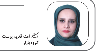
کهر آینه قدیم پرست گروه بازار

حال باغلی می کسب شد هزینه های حاشیه ای و متنوع آن را چگونه جبران خواهند کرد. همچون هزینه های وارده به خودرو و قطعات منهدم شده یا خسارت دیده آن، هزینه اوقات تلف شده ، هزینه جراحات جسمانی، هزینه درد، غم، جراحات روانی و ضدمات روحی.به راستی جان و مال ملت به چه قیمت.