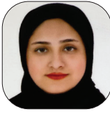
کتره مهریزان خوشبخت گروه صنعت

یک کارشناس صنعت ریلی گفت: در مدیریت راه آهن در دوره‌های قبلی، شرکای بخش خصوصی در تصمیم‌گیری‌های کلان دخالت داده می‌شدند و برایشان مهم بود که از این بخش مشورت بگیرند. اما در دو سال گذشته این رویه تغییر کرده و بخش خصوصی طرف مشورت در تصمیم‌های مهم نبوده و خروجی این وضعیت تضعیف بخش خصوصی بوده است. تضعیف بخش خصوصی دو معنا دارد یا می‌خواهند این صنعت را نابود کنند و اصلاً وجود نداشته باشند یا این که بخش خصوصی باشد، اما امور دست دولت باشد و راه آهن تصدی‌گری کند.