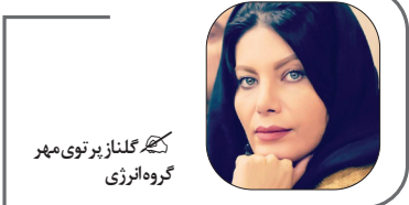
کتره گلنار پرتوی مهر گروه انرژی

بر اساس گزارش رویترز، جو بایدن، رئیس جمهور آمریکا، هفته گذشته تعلیق شش ماهه تحریم‌ها علیه صادرات نفت ونزوئلا را اعلام کرد. این اقدام می‌تواند به افزایش صادرات این کشور کمک کند و تا حدودی ریسک اختلال عرضه در مناطق دیگر را جبران کند.