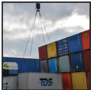
عوارض ورود مواد اولیه به مناطق آزاد صفر تا ۱۰ درصد تعیین شد

وی گفت: تا امروز ۹۰ شرکت در این کنسرسیوم مشارکت و بر روی تهااتر، اعلام آمادگی کردند تا ۲۰۰ هزار میلیارد ریال معادل ۲۰ هزار واحد مسکونی در توسعه ملی مسکن مشارکت کنند. نماینده مجلس آذربایجان شرقی در ادامه افزود: انجام این اتفاق مهم، مسئله کمبود نقدینگی دولت را حل می‌کند و امیدوارم این رقم تا ۵۰۰ هزار میلیارد ریال هم برسد.رئیس فراکسیون راهبردی مجلس شورای اسلامی تاکید کرد: مجلس آمادگی دارد در هرجایی که مانع قانونی وجود دارد، ورود کند و از دولت می‌خواهد فضا را تلطیف کرده و آئین‌نامه‌های دستوپا گیر را بردارد تا این مسئله عملیاتی شودوی با اشاره به سخت بودن روند ساخت ۴ میلیون در دولت سیزدهم، گفت: ساخت ۴ میلیون مسکن در دولت سیزدهم قطعاً آسان نخواهد بود و انتظار می‌رود ۲ میلیون مسکن در ابتدای دولت سیزدهم و ۲ میلیون هم در دوره دوم دولت سیزدهم ساخته خواهد و نیازمند کمک دستگاه‌ها و نهادهای دولتی دیگر است.