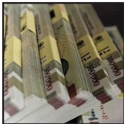
رئیس مرکز اطلاعات مالی وزارت اقتصاد طی بخشنامه‌ای به موسسات مالی

وی افزود: مبلغ گندم‌های خریداری شده از کشاورزان ۳۶۱ استان کشور تا صبح امروز، ۱۰۳ هزار و ۲۳۹ میلیارد تومان بوده است، که بیش از ۵۳ درصد از این میزان به حساب گندم کاران واریز شده و بقیگیری پرداخت مابقی مطالبات در جریان است.