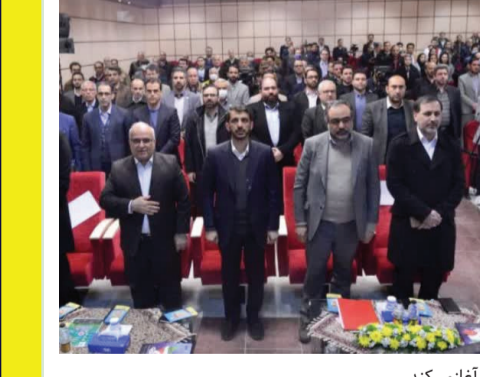
آغاز می کند.