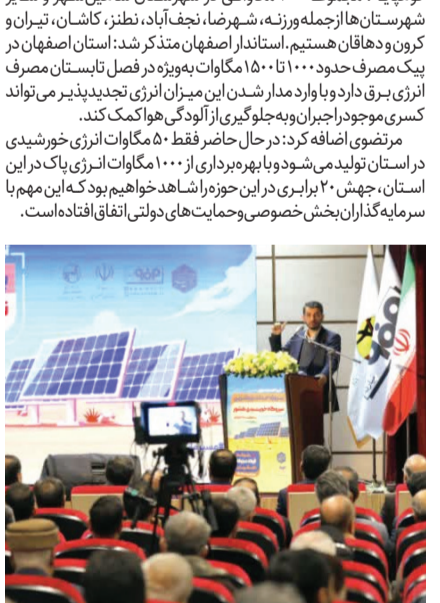
معاون وزیر نیرو و رئیس سازمان انرژی های تجدیدپذیر (ساتبا) تصریح کرد: