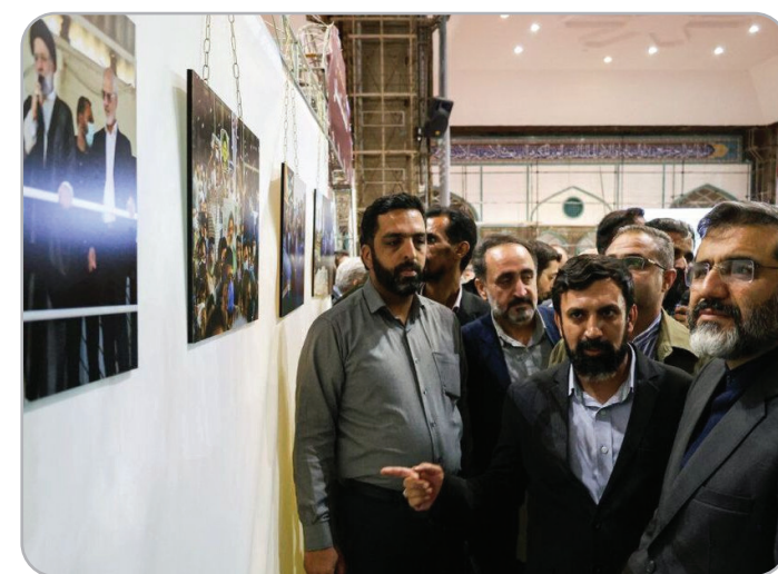
نمایشگاه عکس «هشت سفر» با شرکت توسعه نیشکر و صنایع جانبی همکاری شرکت فولاد خوزستان و با حضور همسر و اعضای خانواده‌ی