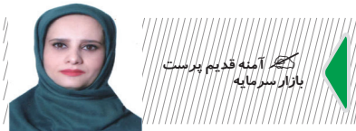
کلیه آینه قدیم پرست بازار سرمایه

آینه قدیم پرست: از سال ۱۳۹۹ و اوج بازدهی بازار سرمایه که در نتیجه دعوت دولت از مردم و ایجاد تفکر تلاوم حمایت‌های دولتی از این بازار رقم خورد بورس با فراز و نشیب های زیادی همراه بوده است. در واقع پس از ریزش تاریخی بازار در همین سال اگرچه با اقداماتی که صورت گرفت بازم بازار به سقف تاریخی خود باز گشت اما درنهایت سیاست های دستوری باعث شد تا از ۱۷ اردیبهشت سال ۱۴۰۲ بازار سرمایه حال روز خوبی نداشته باشد. این در حالیست که کاندیداهای ریاست جمهوری نیز با آگاهی از وضعیت نامناسب بازار ضمن ارائه برنامه ها اوعهده های مختلفی نیز در این راستا داده اند همچون رفع ۳ روزه چالش های بازار که با انتقادات گسترده ای نیز همراه بوده است حال باید منتظر شد و دید پس از انتخاب رئیس جمهور و تکیه زدن بر صندلی پاستور بازار سرمایه چه سمت و سویی خواهد گرفت.