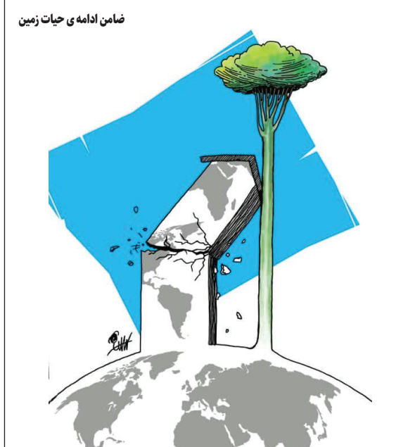
ضامن ادامه‌ی حیات زمین